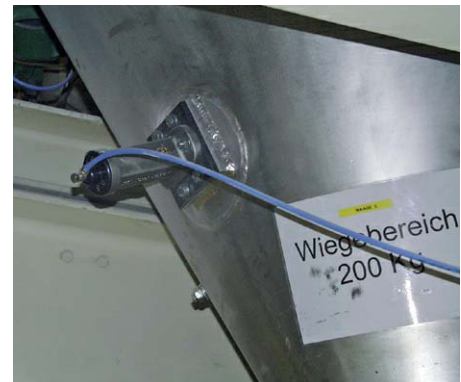
Очистка весового контейнера