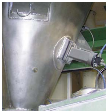
Очистка стенки бункера